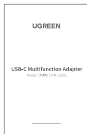
Instrukcja obsługi x1