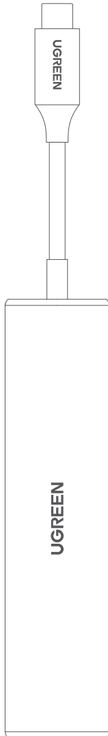
1x Adapter wielofunkcyjny USB-C